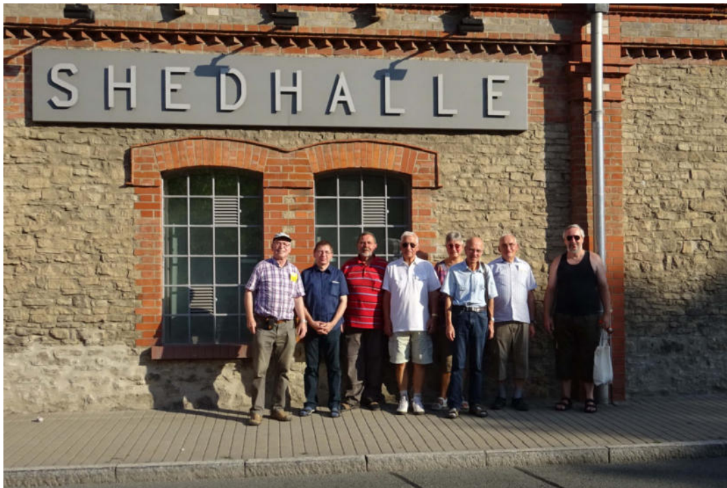
Abbildung Mitglieder des IG Technische Zeitzeugen e.V.